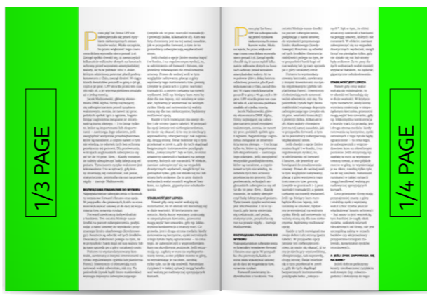
1/3 strony 72x280 mm + spady 5mm