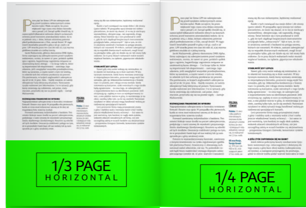
1/3 strony 210x90 mm + spady 5mm