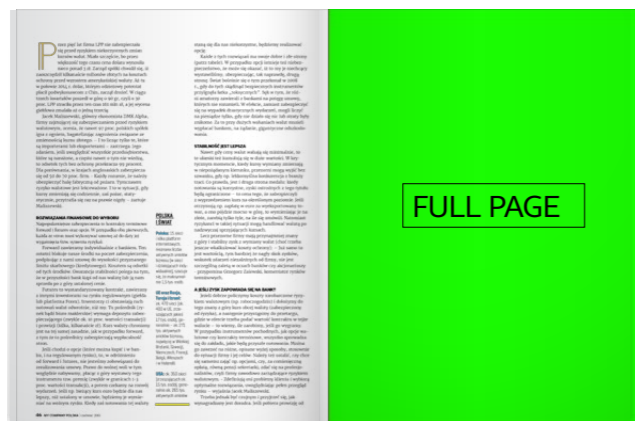
1/1 strona 210x280 mm + spady 5mm