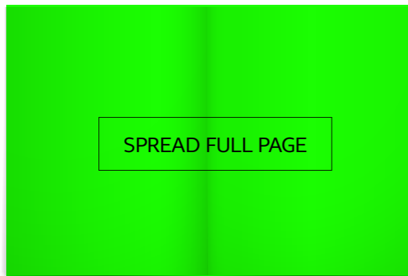
Rozkładówka 420x280 mm + spady 5mm