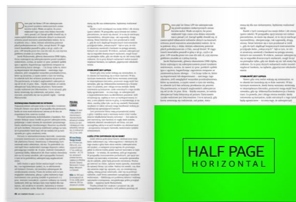
1/2 strony – poziom 210x135 mm + spady 5mm