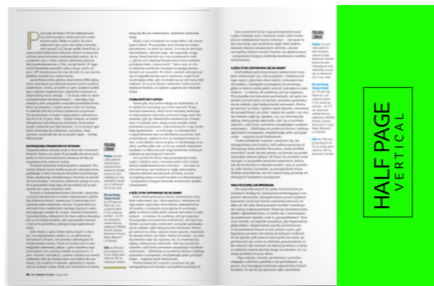
1/2 strony – pion 90x280 mm + spady 5mm