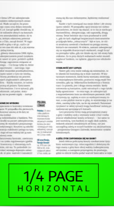
1/4 strony 210x66 mm + spady 5mm